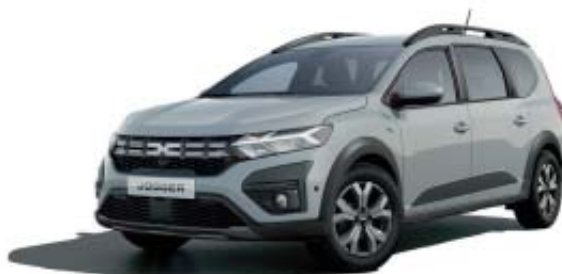
CINZENTO MOONSTONE (1)