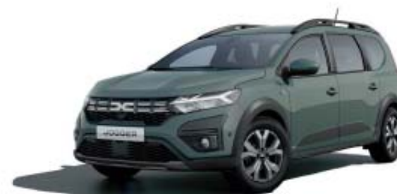
CAQUI LICHEN (2)