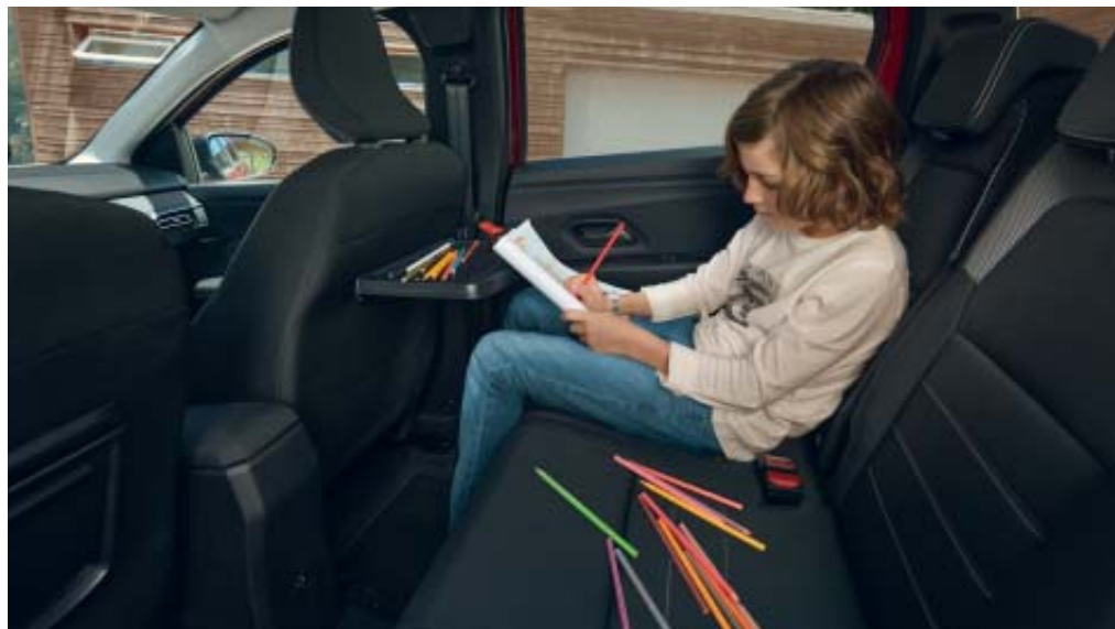
MESAS DESLIZANTES ATRÁS