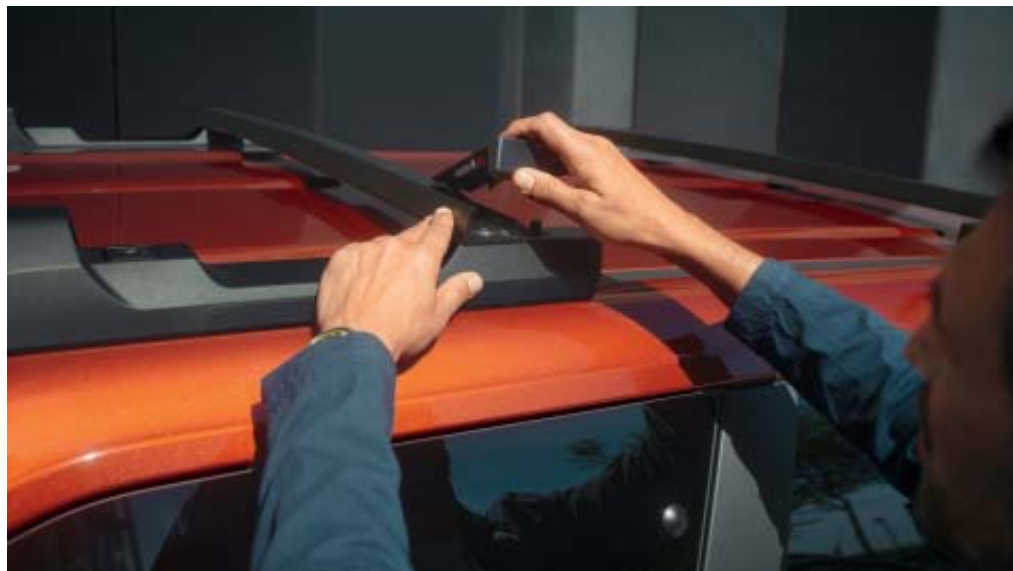
BARRAS DE TEJADILHO MODULARES