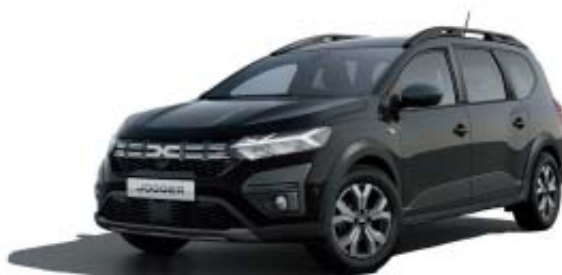
PRETO NACARADO (1)