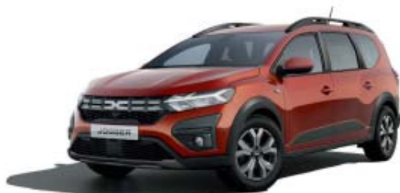
CASTANHO TERRACOTTA (1)