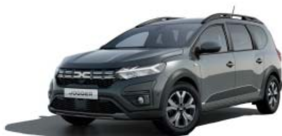
CINZENTO COMETA (1)