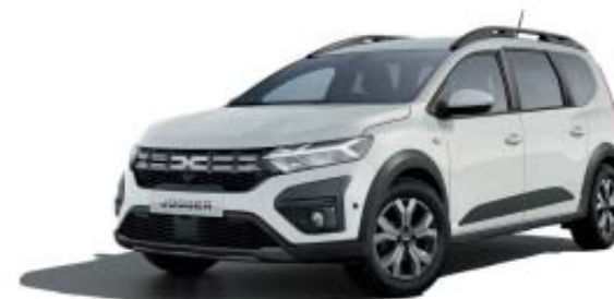
BRANCO GLACIAR (2)