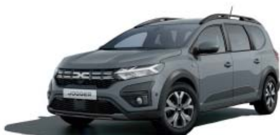
CINZENTO URBAN (2)