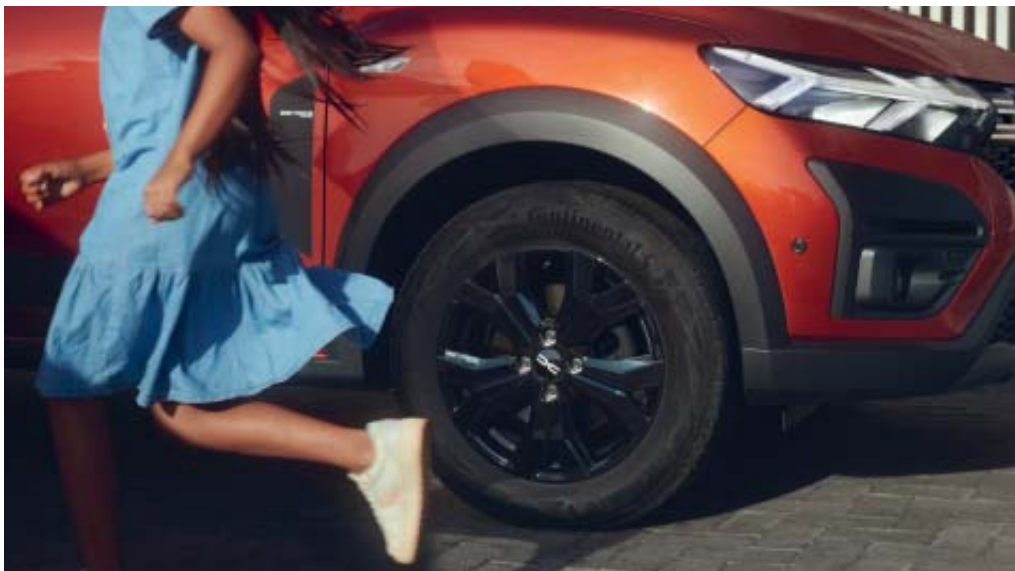
NOVAS JANTES EM LIGA LEVE

vertical das luzes maximiza a ampla abertura do portão traseiro para otimizar o acesso à bagageira. Viva plenamente a aventura, com a versão Série Limitada Extreme: jantes em liga leve, retrovisores e antena shark com revestimento preto brilhante e strappings distintivos. Novo Dacia Jogger, pensado para si e para a sua família.