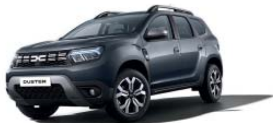
CINZENTO COMETA (1)