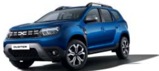
AZUL IRON (1)