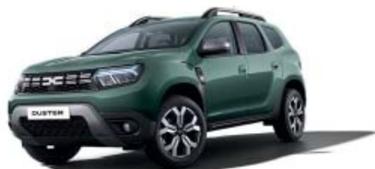
CAQUI LICHEN (2)

(1) Pintura metalizada (2) Pintura opaca