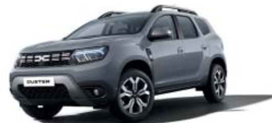
CINZENTO URBAN (2)