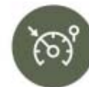
Regulador e limitador de velocidade