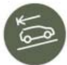
Sistema de ajuda ao arranque em subida (HSA)