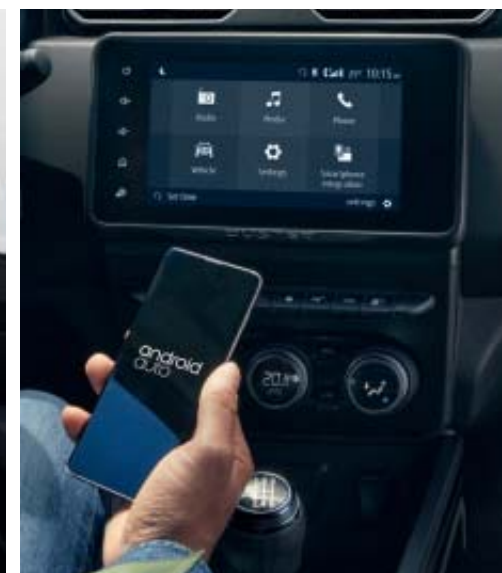
REPLICAÇÃO SMARTPHONE COM CABO USB