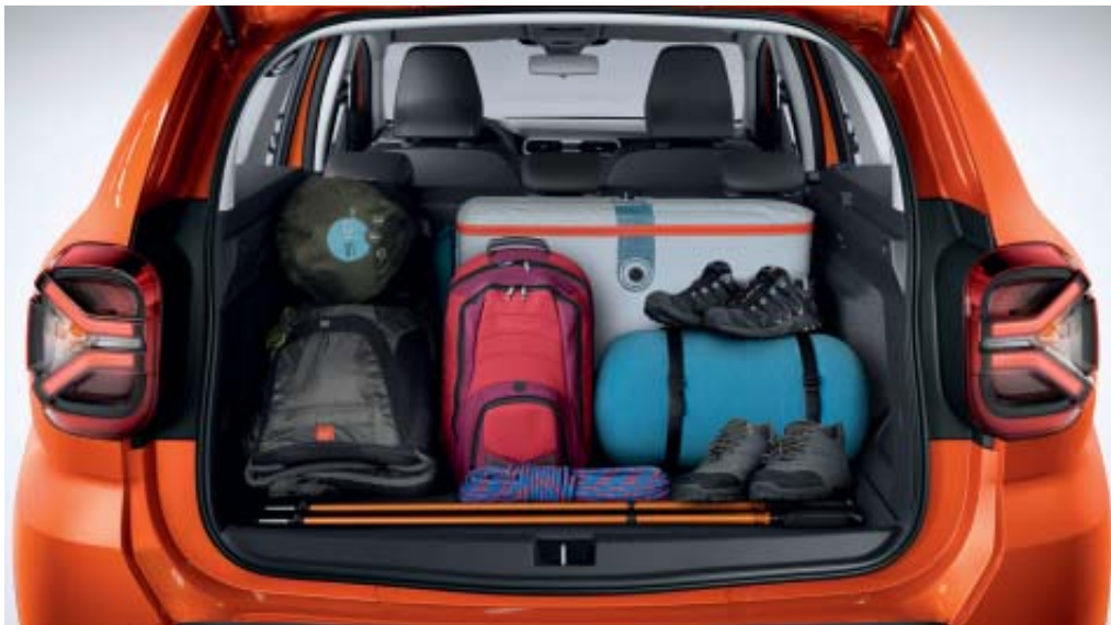
VOLUME DE BAGAGEIRA DE 478 LITROS

espaço interior (banco traseiro com encosto rebatível e fracionável 1/3-2/3) multiplicam as possibilidades de transporte. Nas portas ou nas costas dos bancos dianteiros, os numerosos espaços de arrumação convidam-no a tirar tudo dos bolsos e a viajar de espírito livre!