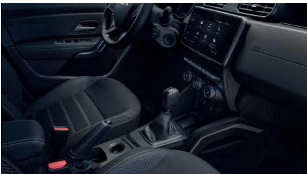
CONSOLA CENTRAL SEMI-ELEVADA COM APOIO DE BRAÇOS E LOCAL DE ARRUMAÇÃO

Android Auto™ é uma marca da Google Inc. Apple CarPlay™ é uma marca da Apple Inc. *Em opção, consoante as versões.