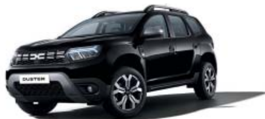
PRETO NACARADO (1)