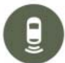
Sistema de ajuda ao estacionamento traseiro