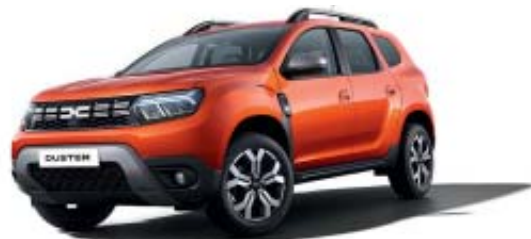
LARANJA ARIZONA (1)