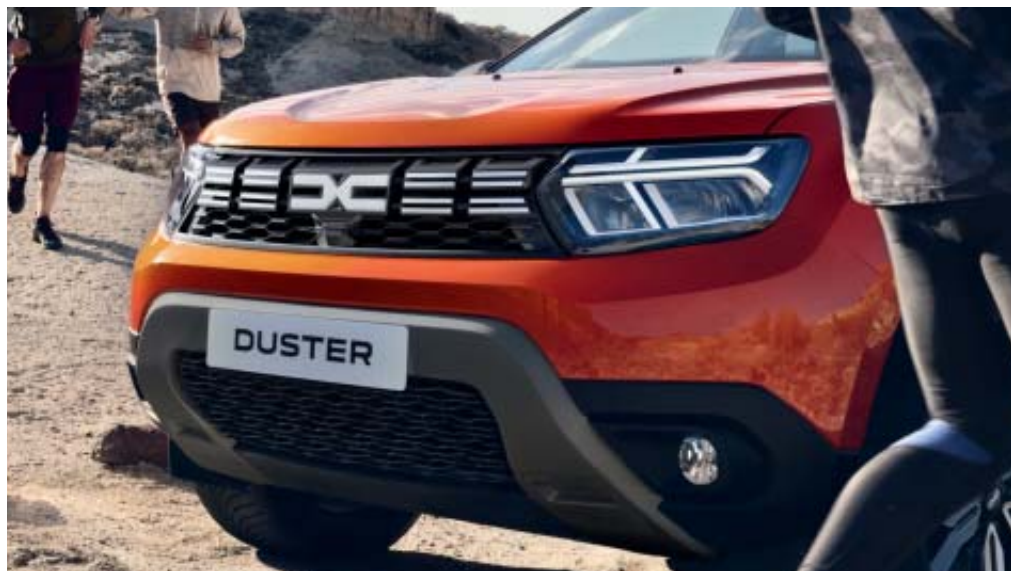
GRELHA DIANTEIRA REDESENHADA