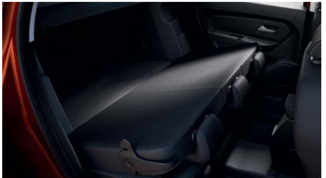
BANCO TRASEIRO REBATÍVEL