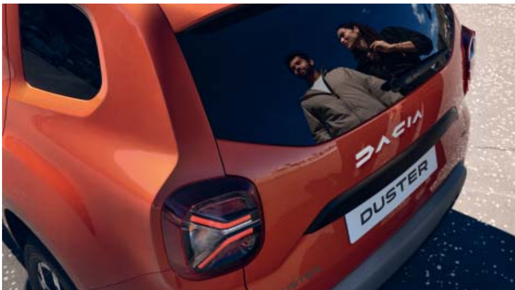
NOVA ASSINATURA LUMINOSA

(1) Médios com tecnologia LED. (2) Consoante a versão.