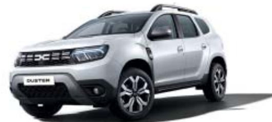
BRANCO GLACIAR (2)