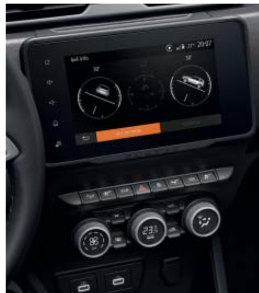
BÚSSOLA E ALTÍMETRO