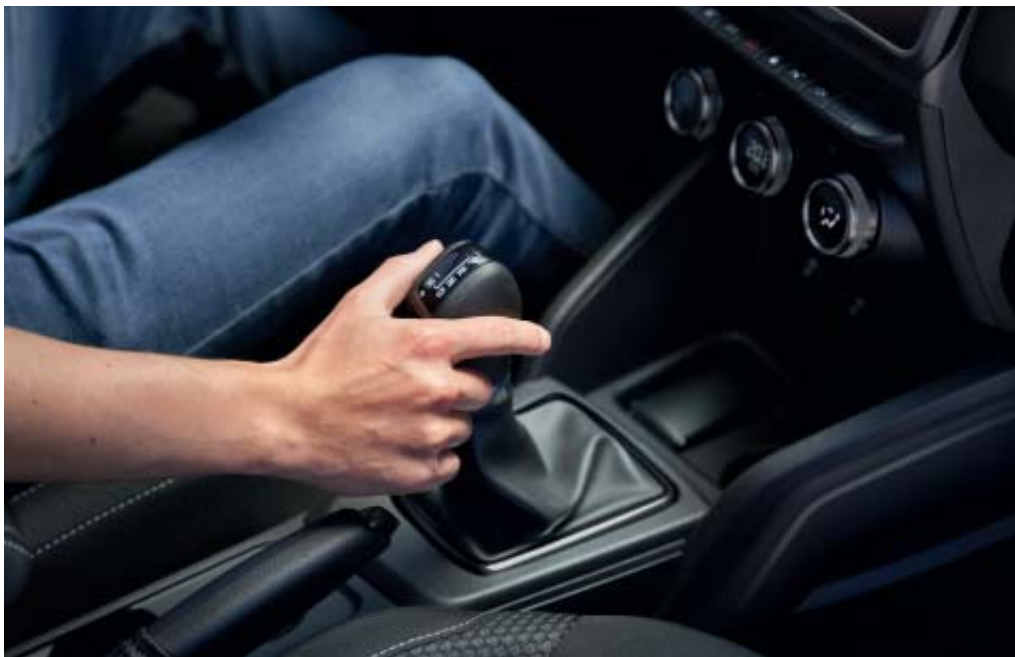
NOVA CAIXA DE VELOCIDADES AUTOMÁTICA (2)

(1) Consoante a versão. (2) Disponível exclusivamente com o motor TCe 150 FAP 4x2