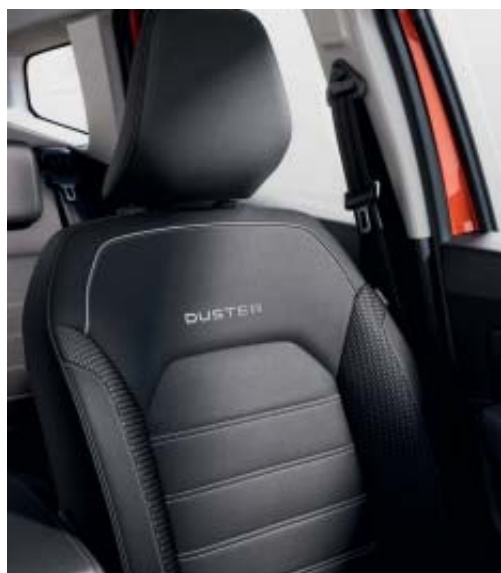
NOVOS ESTOFOS E APOIOS DE CABEÇA