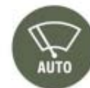
Sensores de luminosidade e chuva